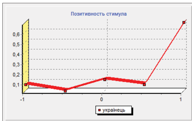
Рис. 3. Конотаційна структура стимулу УКРАЇНЕЦЬ

Серед дій українця респонденти називають: змінює на краще – 0,170; нічого не робить – 0,083; бореться – 0,083; бореться за хороше майбутнє – 0,083; справляє весілля по-українськи – 0,083; живе – 0,083; кричить – 0,083; сподівається на мир – 0,083; виживає – 0,083; воює – 0,083. Серед характеристик такі риси українця: вірний – 0,20; добрий – 0,10; вільний –