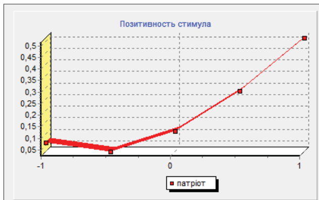
Рис. 1. Конотативна структура стимулу ПАТРІОТ

Бачимо, що коефіцієнт пейоративності конотацій досить низький: 0,05 порівняно з коефіцієнтом меліоративності 0,50. Проміжні точки кривої (на осі Х розташовані на рівні –0,5 і 0,5) набувають коефіцієнтів 0,01 (пейоративний компонент структури) та 0,30 (меліоративний компонент структури). Ці точки на осі Х позначають умовно негативні й умовно позитивні зв'язки, тобто такі, позитивність / негативність котрих наявна, проте, на