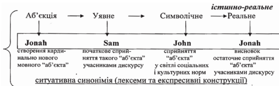
Рис. 1. Розвиток «аб'єкта» в дискурсивному полі

Висновки. Виникнення в тексті кардинально нового «аб'єкта» (результату дії свідомості в сучасних інформаційних умовах), його розвиток у дискурсі й подальше приєднання нових лінгвістичних форм на основі ситуативної синонімії та, як наслідок, фінал-висновок, виражений лексичною формою з певним когнітивним значенням, створюють завершену думку, забезпечують зв'язок тексту та виступають як його структура й каркас.