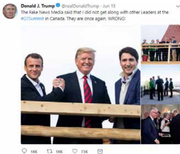
Рис. 2. Мультимодальне доведення із спільним типом аргументації

News Media said that I did not get along with other Leaders at the #G7Summit in Canada. They are once again, WRONG! [25]: