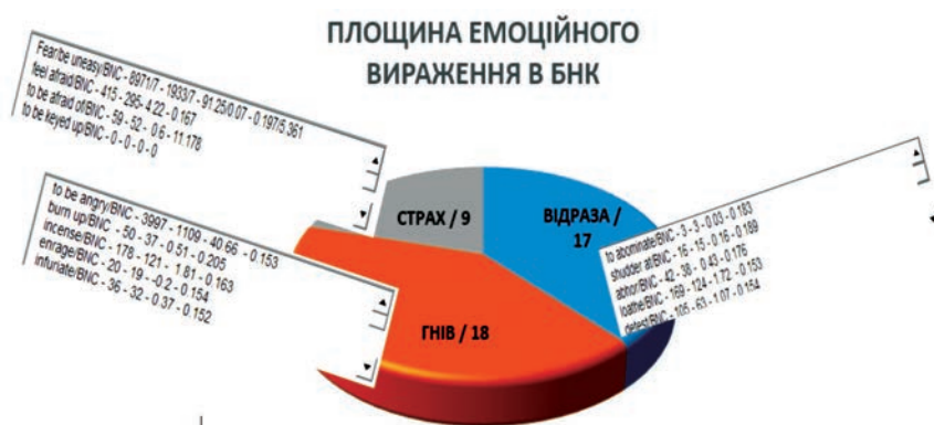
Рис. 1. Когнітивно-тегова матриця фразово-дієслівних емотивів на позначення станів «Відраза» – «Гнів» – «Страх»

Побудова когнітивно-тегової матриці (Рис. 1) дала змогу візуально представити тісні перехресні зв'язки між фразово-дієслівними позначеннями, наприклад, емоційного стану «Відраза», що, як правило, виникає разом зі станом «Гніву» та «Страху» через бажання людини позбутися чогось або