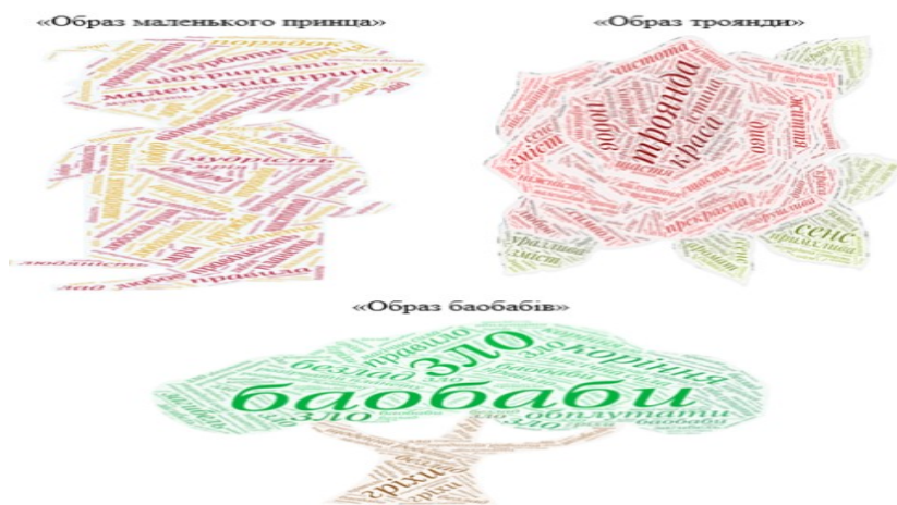
Рис. 1. Хмарки слів

Висновки. Таким чином, у сучасній системі організації навчання у фахових ЗВО застосування технології освітньо-літературного веб-квесту є невід'ємною складовою частиною забезпечення якісної освіти. Її використання розкриває можли-