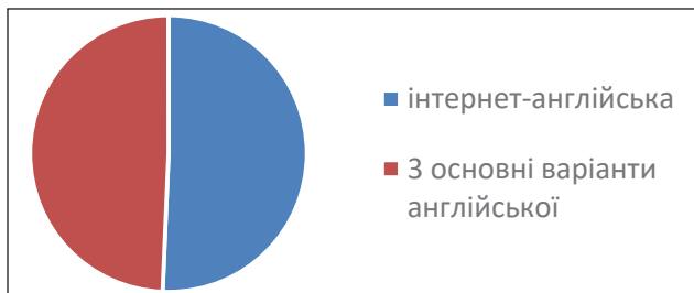
Діаграма 1. Порівняння вживання конструкції типу СД + ім./займ + to-інфінітив в чотирьох найпоширеніших варіантах англійської мови

У таблиці 3 представлено порівняння частоти вживання конструкції компонентів типу сенсорне дієслово + іменник/займенник + to-інфінітив в залежності від стилів спілкування англійською мовою. Дані таблиці показують, що сенсорні дієслова сприйняття зором, на дотик та загального сприйняття найчастіше вживаються з to-інфінітивними компонентами, на протилегу сенсорним дієсловам сприйняття на смак та на нюх, яким практично не властиво приймати в якості компоненту конструкції типу СД + ім./займ. + to-інф. Тому, можна зробити висновок, що в трьох досліджуваних стилях англійської мови найчастішими у вживанні є to-комplementи сенсорних дієслів, що зустрічаються на веб-сторінках (54 % із 2765 відібраних випадків), потім в письмовій англійській мові (40 %) і найрідше в розмовній англійській мові (6 % відповідно).