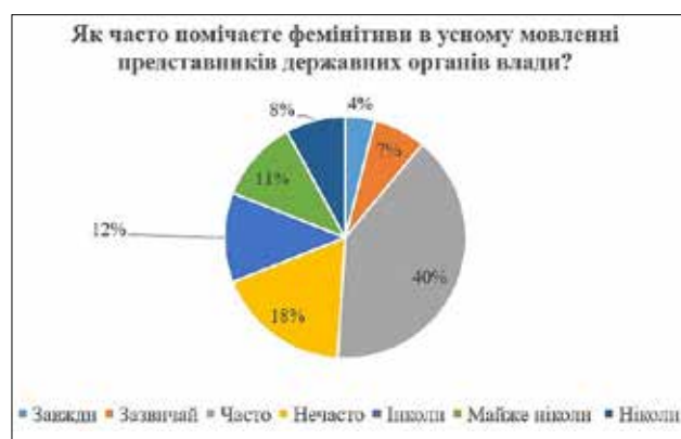
Діаграма 3. Відповіді респондентів на запитання анкети «Як часто ви помічаєте фемінітиви в усному та писемному мовленні представників державних органів влади?»

На переконання учасників анкетування, лише 40 % представників державних органів влади часто використовують фемінітиви в усному та писемному мовленні, 4 % – завжди, 7 % – зазвичай, 12 % – інколи, 18 % – нечасто, 11 % – майже ніколи, 8 % – ніколи (Діаграма 3).