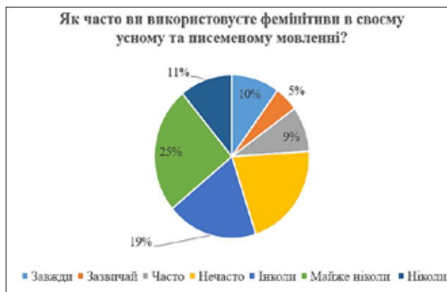
Діаграма 2. Відповіді респондентів на запитання «Як часто ви використовуєте фемінітиви у своєму усному на писемному мовленні?»

Однак сучасна молодь нечасто віддає перевагу вищезгаданім інноваціям під час спілкування. 10 % від загальної кількості респондентів обрали відповідь «Завжди»; 5 % – «Зазвичай»; 9 % – «Часто»; 19 % – «Інколи»; 21 % – «Нечасто»; 25 % – «Майже ніколи»; 11 % – «Ніколи» на запитання: «Як часто ви використовуєте фемінітиви у своєму усному на писемному мовленні?» (Діаграма 2).