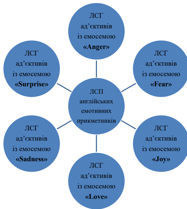
Рис. 1. Структурна репрезентація ЛСП емотивних прикметників

До емотивних прикметників, що виступають у відповідних групах основними лексемами-ідентифікаторами, належать такі одиниці, як joyful (радісний), loving (люблячий), surprising (який дивує), angry (розгніваний, роздратований), fearful (страшний, жакливий), sad (сумний, засмучений). На їх основі були виокремлені навколоядерні зони ЛСГ емотивних прикметників, до яких належать основні підгрупи, що утворюються за принципом загальних компонентів значення, притаманних словам цих лексичних утворень, та організуються на основі таких домінуючих ад'єктивів: